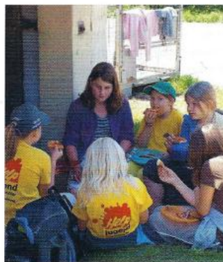
Pizza vor dem Ofenhaus.