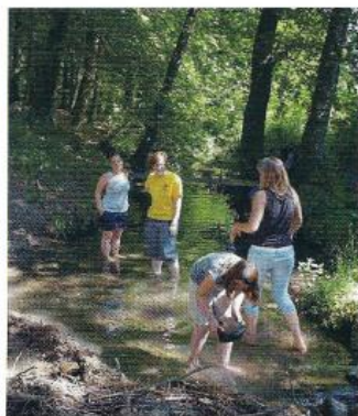
Der Bach wird für den «Schiffbetrieb» gestaut.

Den Abend verbrachten alle gemütlich am Lagerfeuer, bevor sich die Kinder müde in die Schlafsäcke kuschelten. Am Morgen gab es den selbst gebackenen Zopf zusammen mit Kakao, bevor alle zufrieden und müde nach Hause gingen.