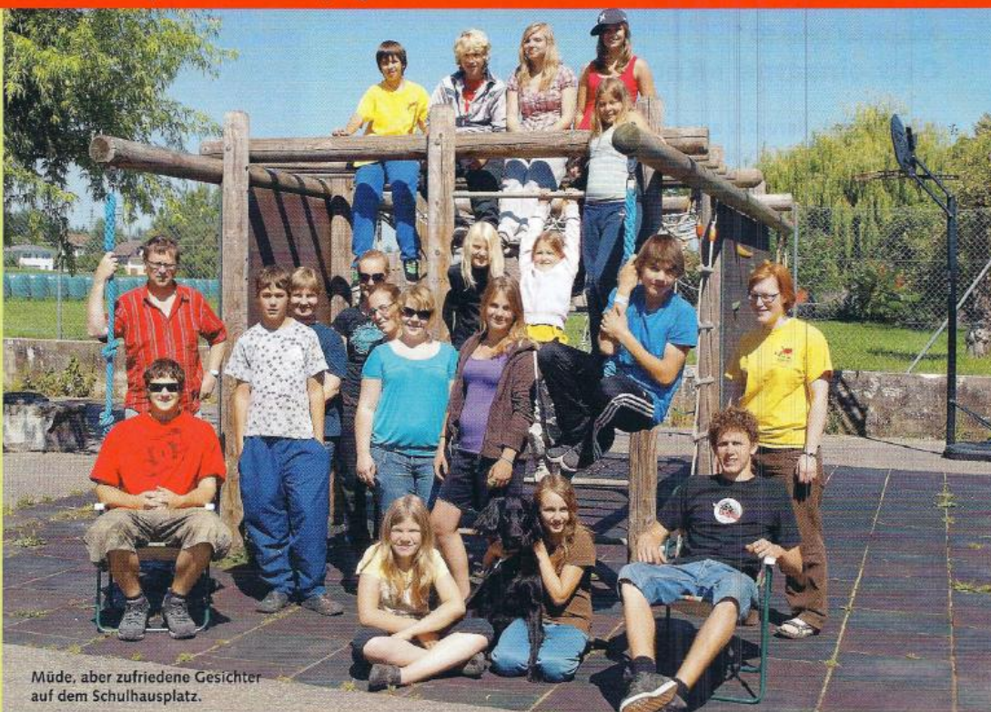
Müde, aber zufriedene Gesichter auf dem Schulhausplatz.